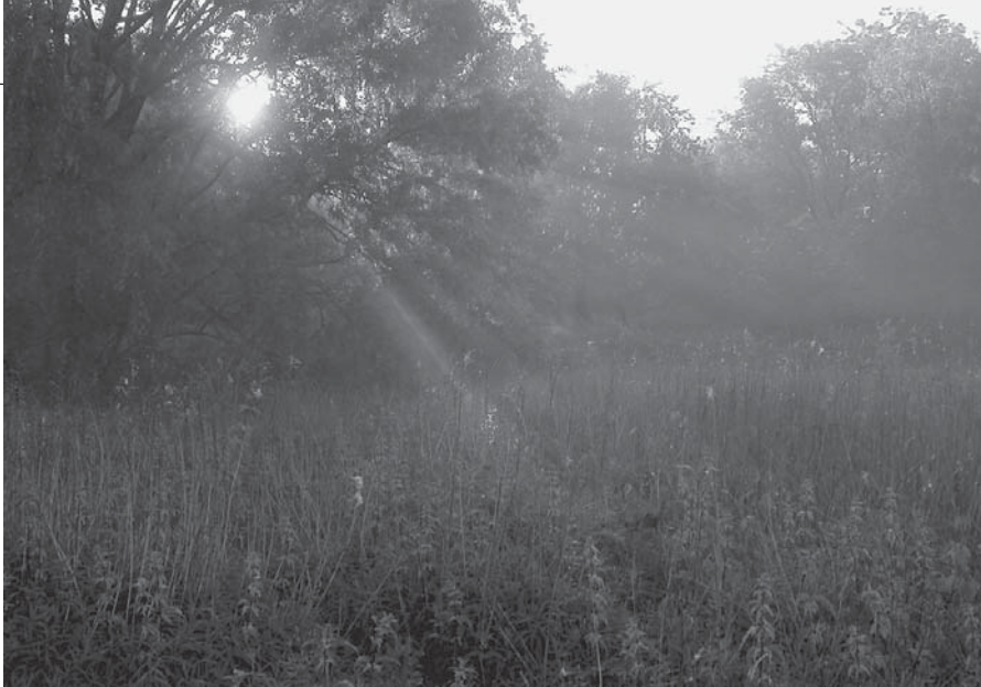
Op sommige plaatsen zijn de brandnetelruigtes in juni zeer hoog opgeschoten.

Dit stukje groen, dat op het gewestplan grotendeels als parkgebied is ingekleurd, wordt steevast aangeduid met de naam Sint-Baafskouterpark. Dit is ongetwijfeld om een onderscheid te maken met het sportcomplex Rozebroeken. De zandige Sint-Baafskouter ligt evenwel ten westen van het terrein en lag oorspronkelijk minstens een tweetal meter hoger dan de Rozebroeken. Dit hoogteverschil is nog slechts op enkele plekken waar te nemen, omdat het grootste gedeelte van het toekomstige park en het sportterrein in het verleden volgestort zijn. Het Sint-Baafskouterpark zal dus wel degelijk gerealiseerd worden in de historische Rozebroeken.