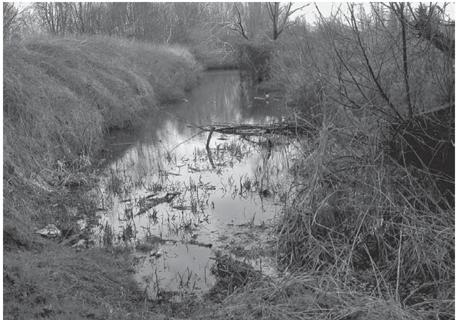
Door het omleiden van de beek ontstond een in bepaalde perioden zuurstofloze arm.

Ongeveer de helft van de historische Rozebroeken ligt namelijk op het grondgebied van Destelbergen. De oppervlakte aan laaggelegen gronden is hier veel groter. Veel percelen zijn ingeplant met populieren maar hebben nog de kenmerkende dwarsloten op de hier ingebuisde Rozebroekbeek. Op een perceeltje met veel zwarte elzen deed ik trouwens in 2002 een bijzonder leuke vondst: