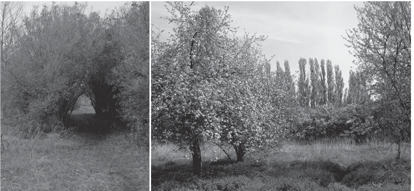
Fors uitgegroeide haagligusters vormen op sommige plaatsen mooie lovertunnels (links). In mei laten de tientallen bloeiende fruitbomen niemand onberoerd (rechts).

nog aanwezige haagligusters. Die zijn fors uitgegroeid en vormen op sommige plaatsen mooie lovertunnels die jong en oud aanspreken, maar blijkbaar ook spotvogels , die hier in 2003 twee broedterritoria afbaken. Eksters bouwen hun nesten dan weer bij voorkeur hoog in de boven alles uitstekende Italiaanse populieren . Sommige exotische overblijvers van het tuinverleden zoals seringen , forsythia's en coniferen geven het terrein op bepaalde plaatsen een behoorlijk chaotische aanblik. Bij enkele van die laatste heeft de nood aan gratis kerstgroen tot bizarre snoeivormen geleid. Liefhebbers van inheemse natuur hebben waarschijnlijk echter meer oog voor de fors uit de kluiten gewassen hazelaars , hondsrozen , egelantiers en spontaan (?) gevestigde eiken . En in mei laten de tientallen bloeiende fruitbomen niemand onberoerd.