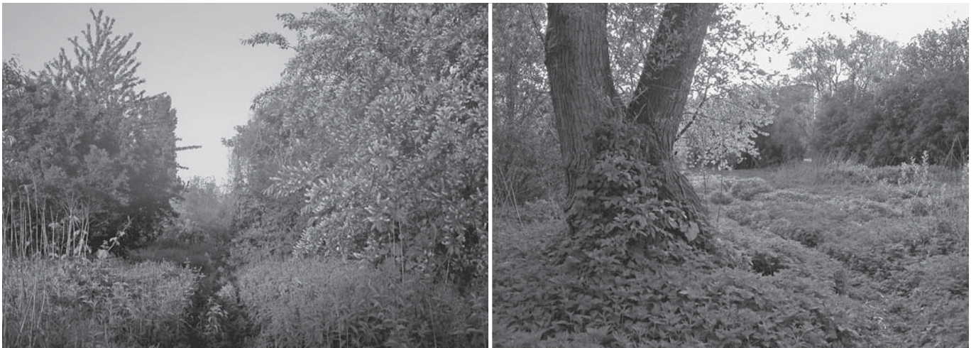
Zomer in de prettige wildernis van de Rozebroeken

Een beetje verder staat in datzelfde document: "Concrete projecten van participatie in het beheer van het openbaar groen zullen uitgewerkt worden in de Groene Vallei, Sint-Baafskouter, ...". De vertrouwensbasis om als ASBR hierin mee te stappen, is momenteel een beetje zoek. Maar laat ons niet vooruitlopen. De inrichting van het park is nog helemaal geen feit. Het definitieve inrichtingsplan moet (dit voorjaar?) nog voorgesteld worden en fase 2 van de verwerving van een aantal kleinere percelen is ook nog niet rond. ASBR blijft het in functie van de buurt en vertrekkend vanuit een ecologische visie op de voet volgen.