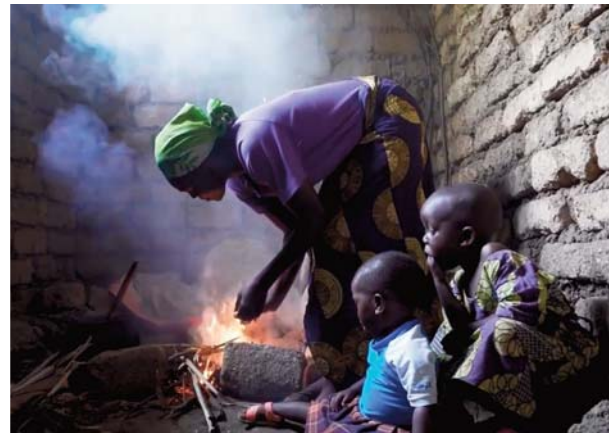
Kookkachels op pellets verminderen rook en gifdampen met meer dan 90% en het houtverbruik met 85%.

den ze geconfronteerd met een onevenwichtige concurrentie van grote commerciële landbouwbedrijven.