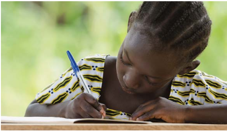
Hernieuwbare energie op het platteland zorgt ervoor dat er 's avonds nog elektriciteit en dus ook verlichting in huis is.