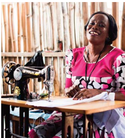
Door microfinanciering kunnen mensen die geen toegang hebben tot financiële instellingen toch zelf een bedrijfje starten en hun situatie verbeteren.

Vanaf december 2018 gaat Natuurpunt Gent in zee met Oikocredit. De projecten van deze organisatie, die zich toespitst op microfinanciering, duurzame landbouw, eerlijke handel en hernieuwbare energie in het Zuiden, verdienen volgens ons alle steun. Dat er meteen ook geld terugvloeit naar de Vinderhoutse Bossen, is daarbij een kers op de taart