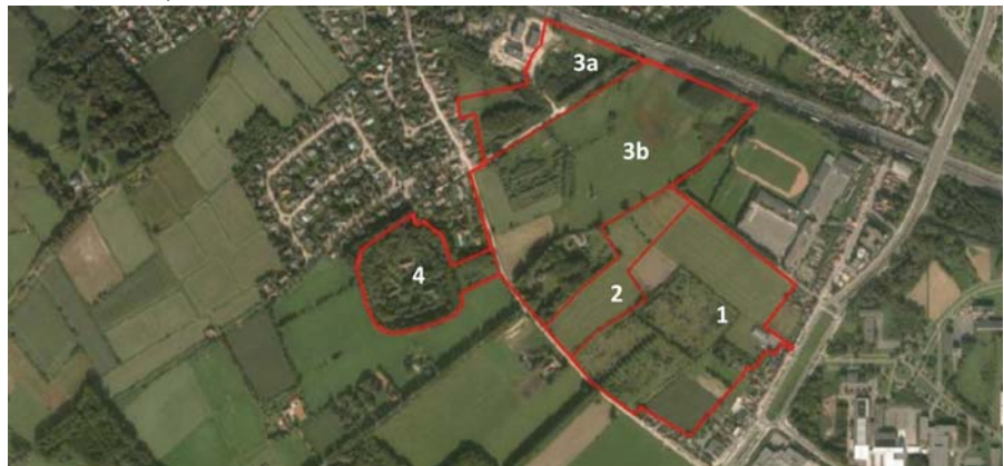
KAART 3: DE DEELGEBIEDEN VAN RIJVISSCHE

den in 2015 aankopen. In het Hutsepotbos vinden we onder andere zomereik, berk, wilg, veldesdoorn, boskers en plataan. De veldesdoorns zijn in lijnverband aangeplant en omzomen het bos (langs de veldwegen). Dwars door het bos, langs de voormalige trambedding, is een platanenrij aangeplant. In het bos zijn nog heel wat grazige, open ruimtes. De gemaaide boszomen vertonen de kenmerken van een glanshavergrasland met aanwezigheid van peen, veldzuring, berenklauw, boerenwormkruid, Jakobskruid en Canadese guldenroede.