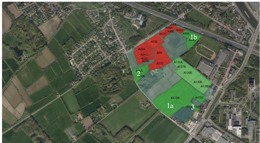
KAART 2: AANKOPEN IN RIJVISSCHE

Het Gentse stadsontwikkelingsbedrijf SO Gent had in deze zone verscheidene percelen aangekocht voor de realisatie van het wetenschapspark. Als reactie op die plannen ontstond het Hutsepotfront, een samenwerkingsverband met onder andere Actiegroep Bourgoyen-Ossemeersen, een van de voorlopers van Natuurpunt Gent. In 2004 werden de gronden grotendeels bebost door het Hutsepotfront - zo ontstond het Hutsepotbos. Na het schrappen van de plannen voor het Wetenschapspark kon Natuurpunt deze gron-