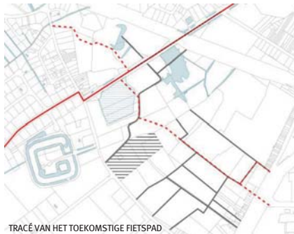
TRACÉ VAN HET TOEKOMSTIGE FIETSPAD

Het nieuw aan te leggen fietspad door Rijvissche (rode stippellijn) zal noordelijk aansluiten op de toekomstige fietssnelweg (volle rode lijn) en ten zuiden zorgen voor een verbinding met het Don Bosocollege. De fietssnelweg op de oude spoorwegbedding is momenteel zo goed als afgewerkt en leidt fietsers via twee bruggen vlot en zonder storend autoverkeer naar de stad Gent of De Pinte. In het kader van de ruilverkaveling Schelde-Leie heeft de Vlaamse Landmaatschappij (VLM) zich verbonden tot aankoop/onteigening van de resterende percelen die nodig zijn om het toekomstige fietspad aan te leggen. Hiervoor wordt een onteigeningsbesluit opgemaakt. Natuurpunt geeft hier ook zijn volle steun aan. In de gebieden die we intussen hebben aangekocht en waar het fietspad doorheen loopt, zal de VLM die stroken van ons overkopen tegen dezelfde prijs die wij hebben betaald.