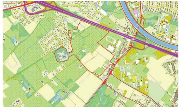
KAART 1: SITUERING RIJVISSCHE

Natuurpunt Gent wil samen met de andere Parkbospartners werk maken van de ontwikkeling van Rijvissche, een belangrijk deelgebied van de groenpool Parkbos dat bijkomende kansen biedt voor de natuur en de recreant in de groenpool. De ideeën zijn al een tijdje verzameld, de plannen werden twee jaar geleden goedgekeurd en nu zijn we volop bezig met de realisatie op het terrein. In september 2018 tekenden we opnieuw een aankoopcompromis, deze keer voor ruim 6 hectare. In dit artikel bekijken we ook de andere aankopen in Rijvissche en het burgerbudgetproject.